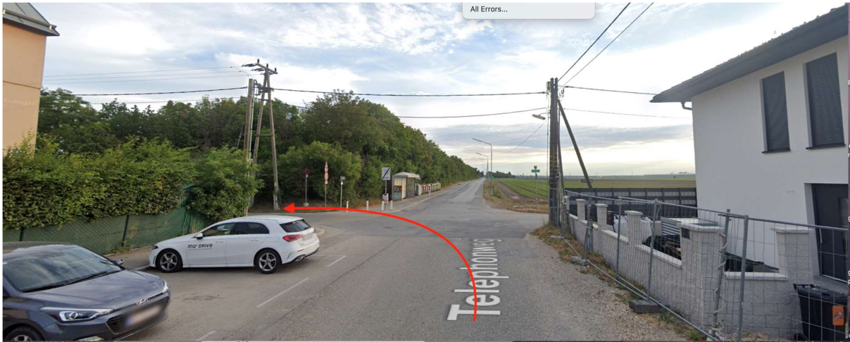
Am Telephonweg die erste Möglichkeit links abbiegen in die Thujagasse