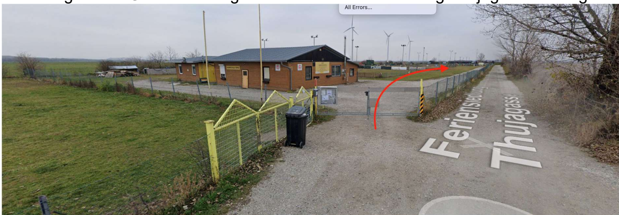
Den ersten Platz nehmen und beim Clubhaus vorbei und weiter geradeaus fahren